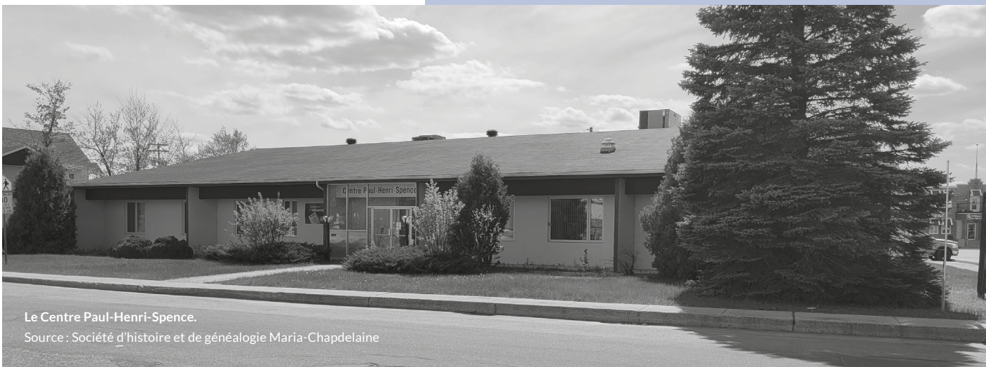
Le Centre Paul-Henri-Spence.