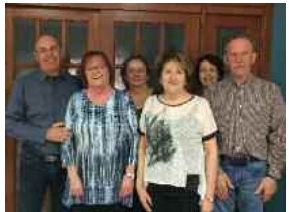
Le comité de généalogie 2016