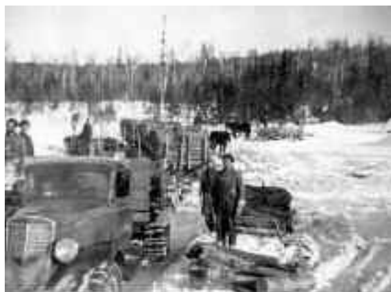
Fonds Benoît Sasseville (P304)

Par la même occasion, une évaluation de la voûte a été réalisée afin de déterminer les priorités d'intervention quant à son organisation. Plusieurs anomalies ont été identifiées et celles-ci font l'objet de recommandations qui permettront à la Société de réaliser sa mission de conservation des archives selon les normes archivistiques en vigueur. Ce rapport détermine plusieurs champs d'intervention par priorité dans l'ordre suivant : sécurité, organisation globale, remaniement, standardisation et entretien.