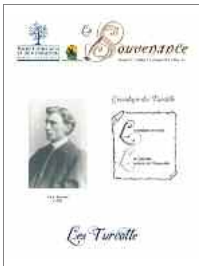
La Souvenance Volume 29, numéro 2

La Société d'histoire a été active à plus d'un égard en ce qui à trait à la mise en valeur des archives. Plusieurs démonstrations et petits projets d'exposition ont été offerts au public au cours de l'année 2016.