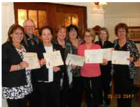
6 e groupe Je me raconte