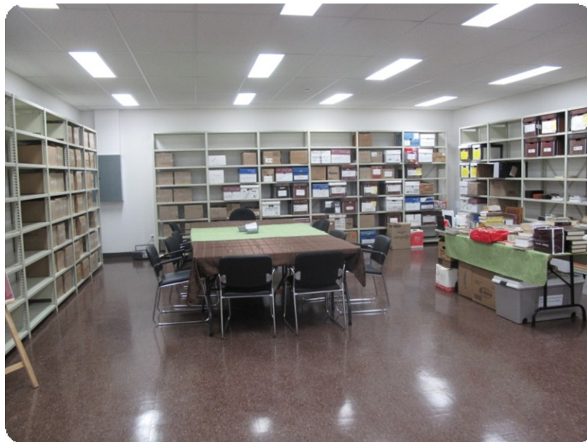
Notre nouvelle salle d'entreposage et de réunion du projet d'agrandissement 2012