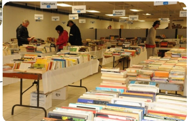
Local pour la vente de livres usagés 2012 (ancien Jean Coutu)